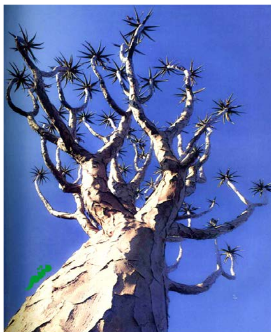
تونی بوزان در کتاب خود، برای نمایش مفهوم "نقشه ذهنی" از تصویر این درخت استفاده کرده است.

تونی بوزان تاکید دارد که ساختار شاخه ای شدن، ساختاری طبیعی است و به وفور در طبیعت یافت می‌شود.